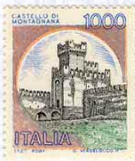
22-9-1980 Serie Ordinaria "Castelli d'Italia" riproducente il Castello di Montagnana

SALA VENEZIANA - CASTEL SAN ZENO MONTAGNANA (PD), 23/24 APRILE 2010